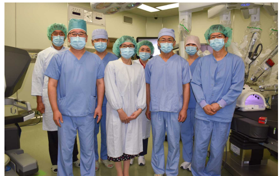
視察に訪れた内藤 佐和子市長と共に(6月30日)