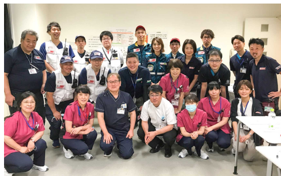
市立宇和島病院・回生病院と講師陣

入院患者のトリアージにて数名の患者を搬出する必要性があり、院内DMAT・職員だけでは限界があるため、鳴門病院（今回のみ当院の上位本部、通常は徳島県立中央病院）へ支援を依頼。指示を受けた県外DMAT（愛媛県：市立宇