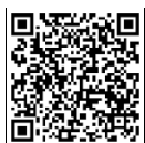
テストセンター会場について

④ 試験開始時間から30分を超えて遅刻した場合、公共交通機関の遅延証明書の提示がある場合を除き、受験はできませんので注意してください。