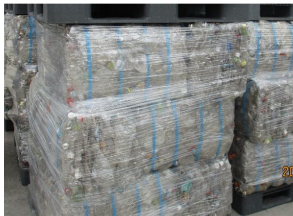
令和8年4月のべール品

市民の皆様のご協力により、3種混合による収集時と比較すると、より品質の高いペットボトルの回収ができています。