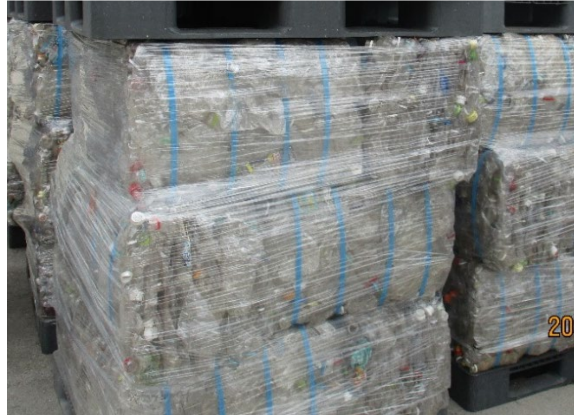
令和8年4月のべール品

令和7年6月時点(左)と令和8年4月時点(右)を比較すると、右の写真の方がキャップやラベルがより多く取り除かれており、また缶、びん等からの内容物の付着が減少していることが分かります。