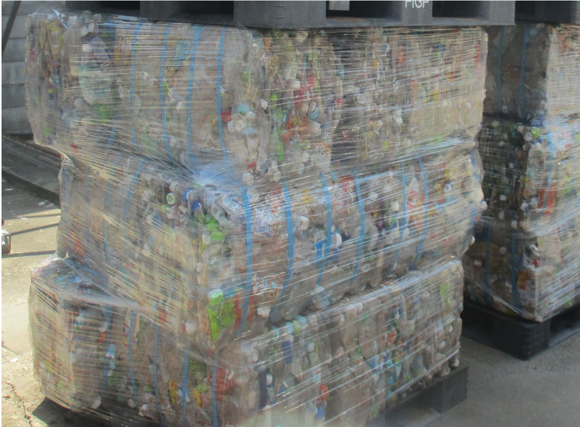
令和7年6月のべール品