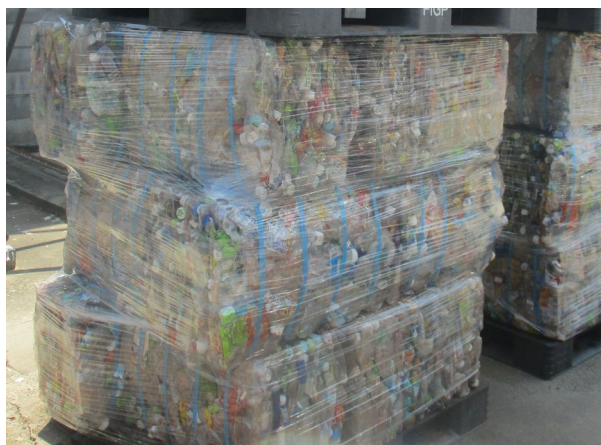
令和7年6月のべール品