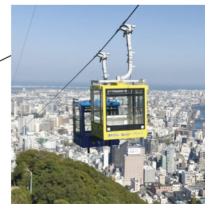
あわぎん眉山 ロープウェイ