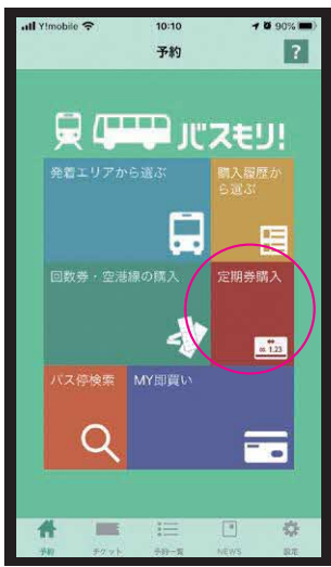
①定期券購入を選択

※アカウント登録が必要となります。サービス利用にかかる通信費はお客様の自己負担となります。