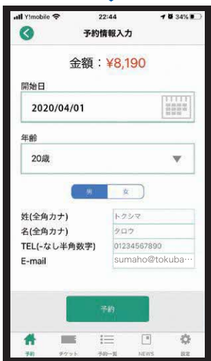
③利用開始日と年齢、性別を選択し予約をタップ