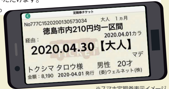
※スマホ定期券表示イメージ

●アプリに関するお問い合わせ/ウェルネット運用センター TEL:011-809-3300 Mail:busmori-pj@well-net.jp