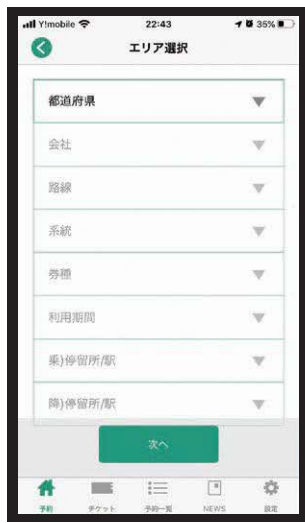
②各項目を選択して入力