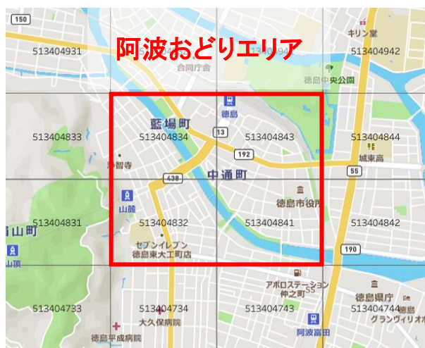
図表 2-2. 阿波おどりエリア

そのため、本推計では、日別と期間別に重複のない来場者数が把握できるドコモインサイトマーケティング社の「モバイル空間統計」を採用し、図表 2-2 に示した阿波おどりの演舞場を含む 1km 2 (500m×500m のエリアを 4 つ)の範囲(以下、「阿波おどりエリア」とする)に、各開催日の 18 時から 22 時台に滞在した者を対象とし、同一開催日と開催期間内で重複をカウントしない来場者数(以下、それぞれ「日別ユニーク」と「期間ユニーク 4 」とする)を、阿波おどりの来場者数として把握している 5 。