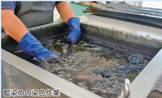
藍染めの染色作業