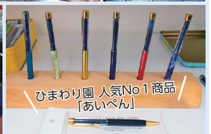
ひまわり園 人気No1商品「あいペン」