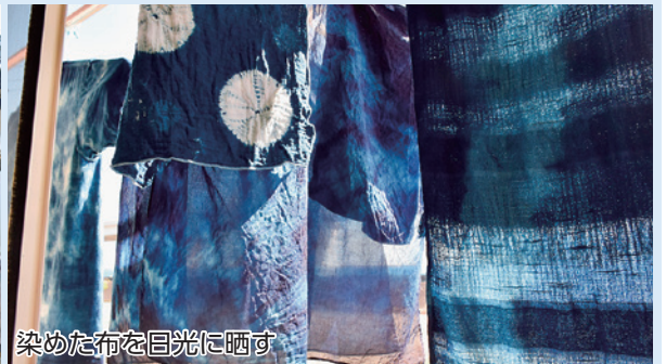
染めた布を日光に晒す