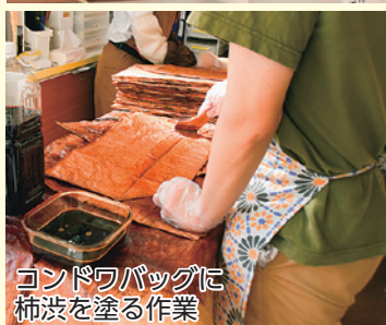
コンドウバッグに柿渋を塗る作業