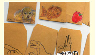
ショップ袋のイラストも手書き