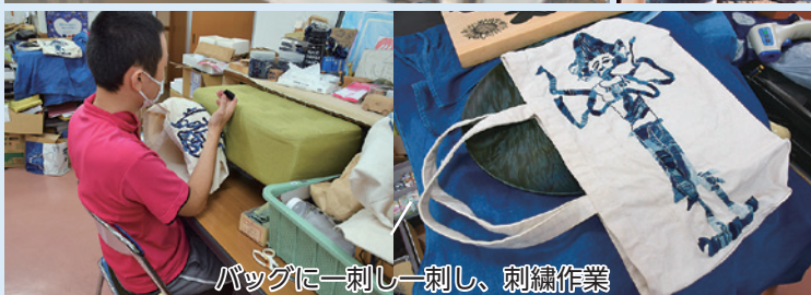
バッグに刺し刺し、刺繍作業