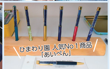
ひまわり園 人気No1商品「あいペン」