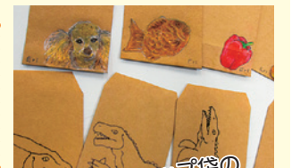
ショップ袋のイラストも手書き