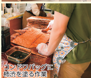
コンドウバッグに柿渋を塗る作業