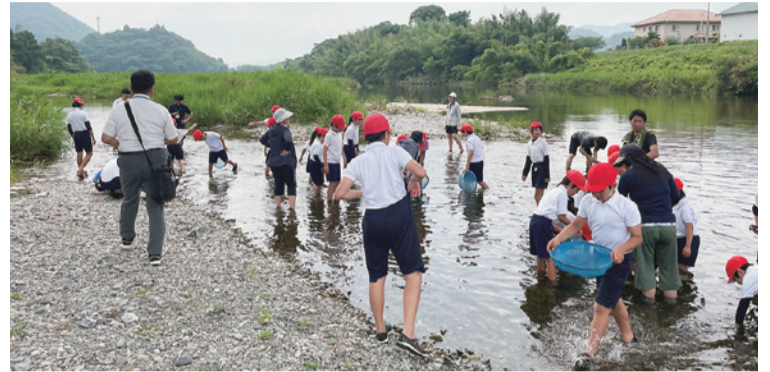
▲市民を対象に開催している出前環境教室での水生生物調査

徳島市は、大小134本の河川が流れ、豊かな水に支えられ発展してきました。しかし、良質な水質の河川がある一方で、一部の河川では住宅からの生活排水などの影響により水質の悪化が報告されています。6月1日から7日までは「市民環境週間」です。恵まれた徳島の環境を守るために、私たちの生活を見直してみませんか。