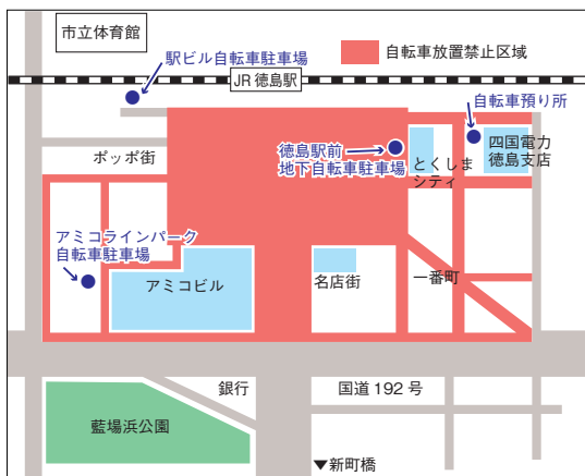
図1 自転車放置禁止区域

市は、昭和59年に「徳島市における自転車の放置の防止に関する条例」を施行し、徳島駅前周辺を「自転車放置禁止区域」と定め、放置自転車の整理(指導・撤去)にあたっています。