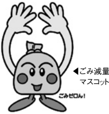
ごみ減量マスコット ごみっぴ

頼んでもいないのに、いきなりダイレクトメールやチラシがポストに入っていることはありませんか。これらは、開封することもなく、結局読まずに捨ててしまうことも多いようです。 受け取りたくないダイレクトメールは、その意思表示をして送るのをやめてもらいましょう。 郵便で届いた場合は、開封する前に郵便物に「受取拒絶」の表示をして、受け取りを拒絶した人の署名、または押印して、ポストに投函すれば、発送元に返送されます。宅配便で届いた場合は、宅配会社によって対応が異なりますので、問い合わせてみましょう。 開封してしまっても、ダイレクトメールでも、ダイレ