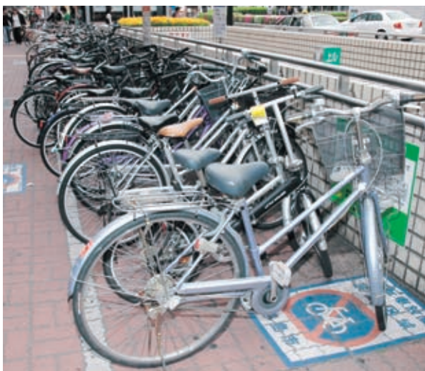
▲自転車放置禁止区域に置かれた自転車