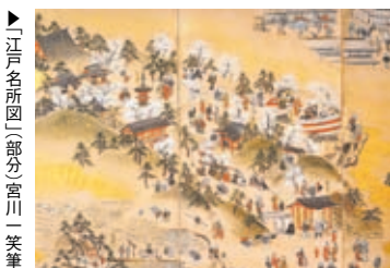
▶江戸名所図(一部分)宮川長春筆