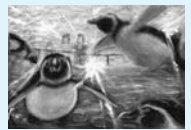
▲第11回特選作品(中学校の部)

作品は、後日審査の後、入賞作品の表彰と展示を行います。 [問い合わせ先]とくしま動物園(☎636-3215)