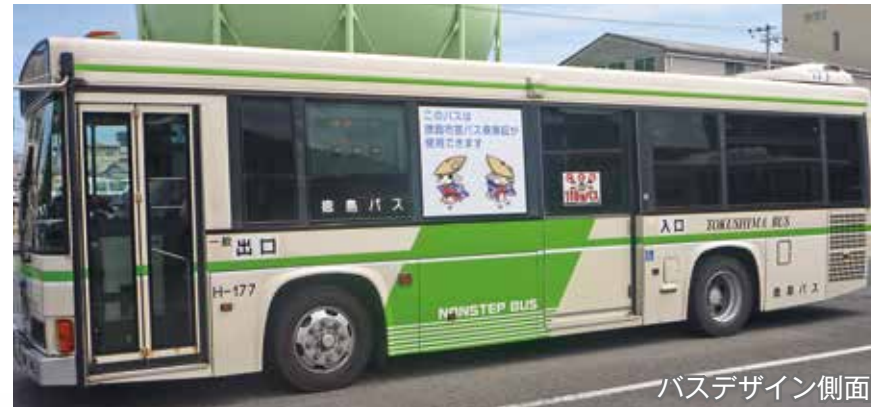
バスデザイン側面

A 徳島バスの車両で運行しますが、他の徳島バスの車両と区別するため、写真(イメージ)のような専用車両で運行します。