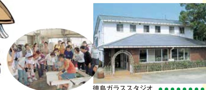
徳島ガラススタジオ