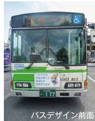
バスデザイン前面