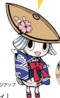
徳島市イメージアップキャラクター「トクシィ」