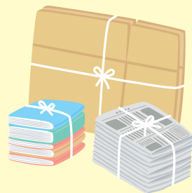
新聞紙・雑誌・ダンボール