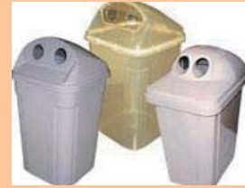
空き容器回収ボックス