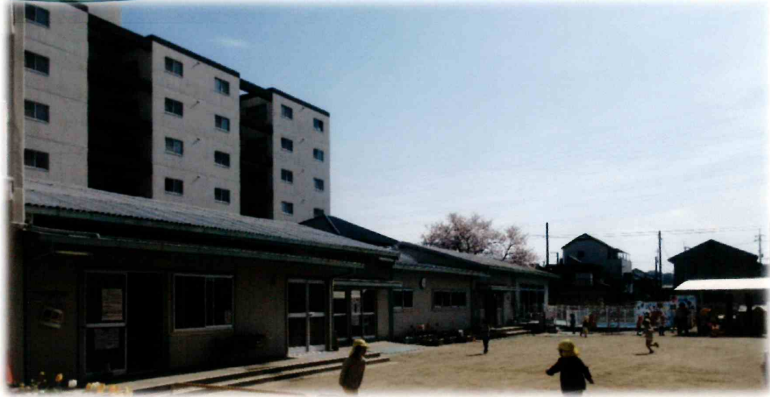
♪どこか懐かしい木造園舎と のびのび遊び浸れる広い園庭