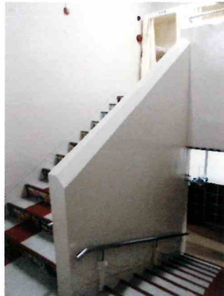
5歳児保育室入り口前のアートな階段を昇ると2階のリズム室↑→ 集会をしたり、リトミックをしたり、お昼寝のお部屋にもなります。