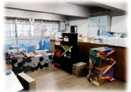
↑7月の5歳児保育室は「忍者屋敷」に変身しました！！ 製作も運営も子どもたちが力を合わせて行いました ♡