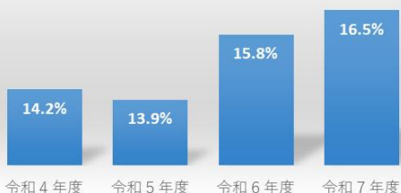
時間外在校等時間が月80時間を超える教職員（市立高）