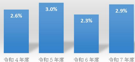
時間外在校等時間が月80時間を超える教職員（小学校）