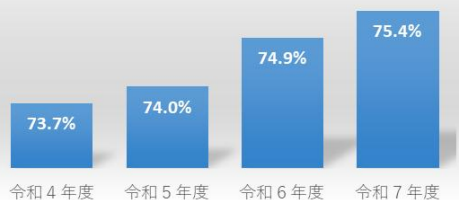
時間外在校等時間が月45時間以内の教職員（小学校）