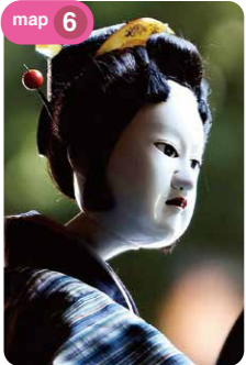
木偶淨琉璃戲的木偶