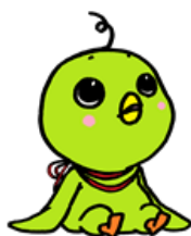
徳島市立図書館キャラクター 「ひよタン」