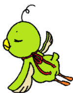
徳島市立図書館キャラクター「ひよたん」