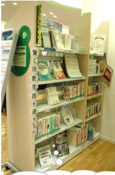
コーナーの場所は⑥番の棚です

徳島大学附属図書館と徳島市立図書館は、図書館による地域貢献を果たすとともに、利用者の利便性や図書館サービスを向上させ図書館の利用を促進し価値を高めることを目的として、それぞれの特性を活かした幅広い連携協力を推進しています。