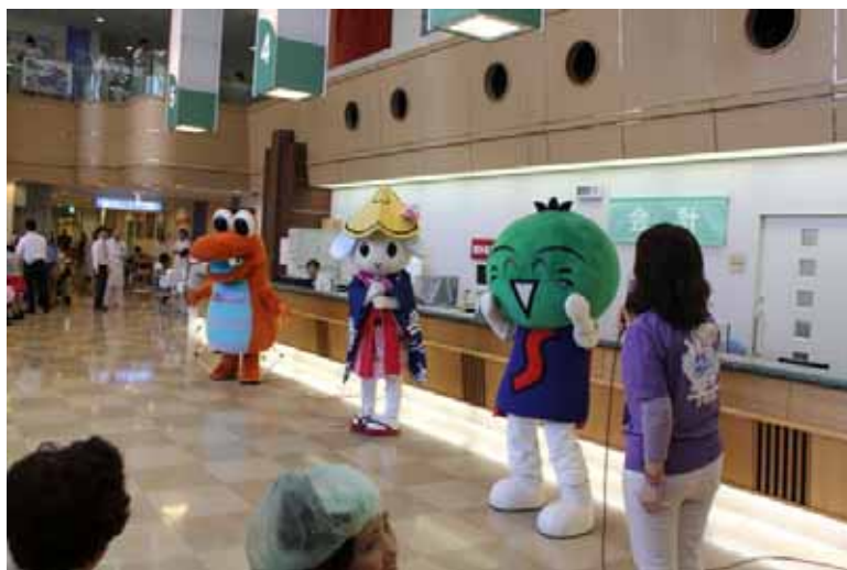
トクシィ・すだちくん・かわに～ズのコラボが実現しました。