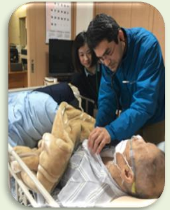
【ご自宅で点滴や採血もできます】