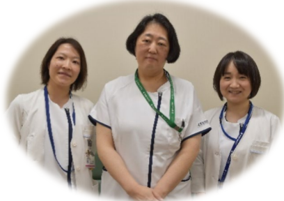
緩和ケアセンター専従看護師

“緩和ケア”とは、病気と闘っている患者さんと、そのご家族を対象とした積極的なケアです。“緩和ケア”という言葉のひびきは、“終末期の方が受けるケア”と、とらえる方も少なくないかと思えます。しかし、“緩和ケア”とは、病期に関係なく、痛みをはじめとする、病気にとともなうさまざまな症状の緩和をめざすケアのことです。その中には、体の症状だけではなく、心のケアや社会・経済的な問題へのケア、退院後の療養生活に向けた支援、希望を支えるためのケアなどが含まれます。緩和ケアチームの紹介を希望される方は、主治医・看護師にご相談下さい。