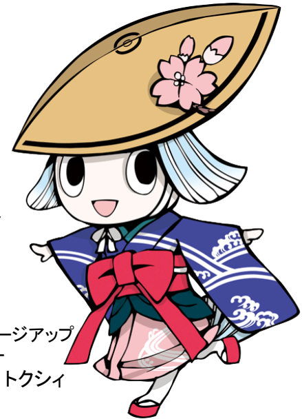
徳島市イメージアップ キャラクター トクシイ