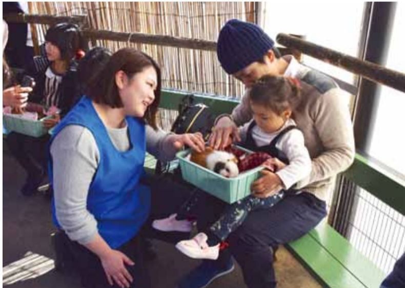
▲動物園ボランティアがサポートするモルモットとのふれあいの様子

博物館に訪れた人が徳島の歴史や文化について、親しみを持ってもらえるようにサポートしているのが、市民ボランティア