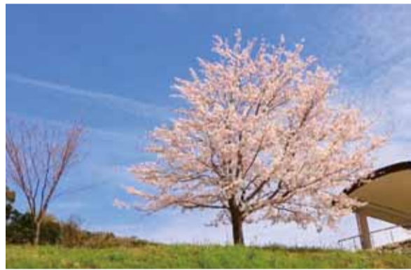
▲昨年度のデジタル部門1位作品「青空と桜」

徳島市の花「さくら」のフォトコンテストを行うにあたり、徳島市内の公園で撮影した今春の桜の写真を募集します。 応募方法は、以下のとおりです。奮ってご応募ください。 【テーマ】徳島市内の公園で