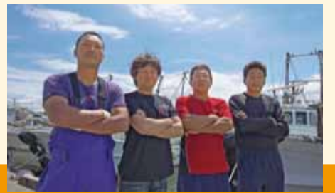
▲徳島市漁協青年部の皆さんと