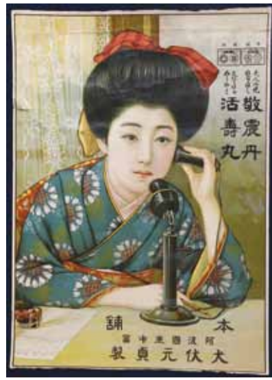
▲「敬震丹/活寿丸ポスター」 犬伏製薬蔵 本 大伏元貞 製 阿波三十五番 誦 大伏元貞