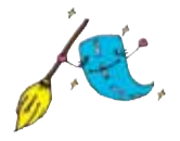
▲みちピカ事業 イメージキャラクター

①町内会、企業、学校などの団体 ②市が管理する道路の清掃や除草をしていただきます。集めたごみは市の分別方法に従って分別してください。市は、清掃用具の支給、傷害・賠償保険への加入費用の負担や搬入されたごみの処理(無料搬入券の交付)などを行います。参加団体は、担当する道路には、団体名や事業名などを記した表示板を設置することができます。詳しくはお問い合わせください。