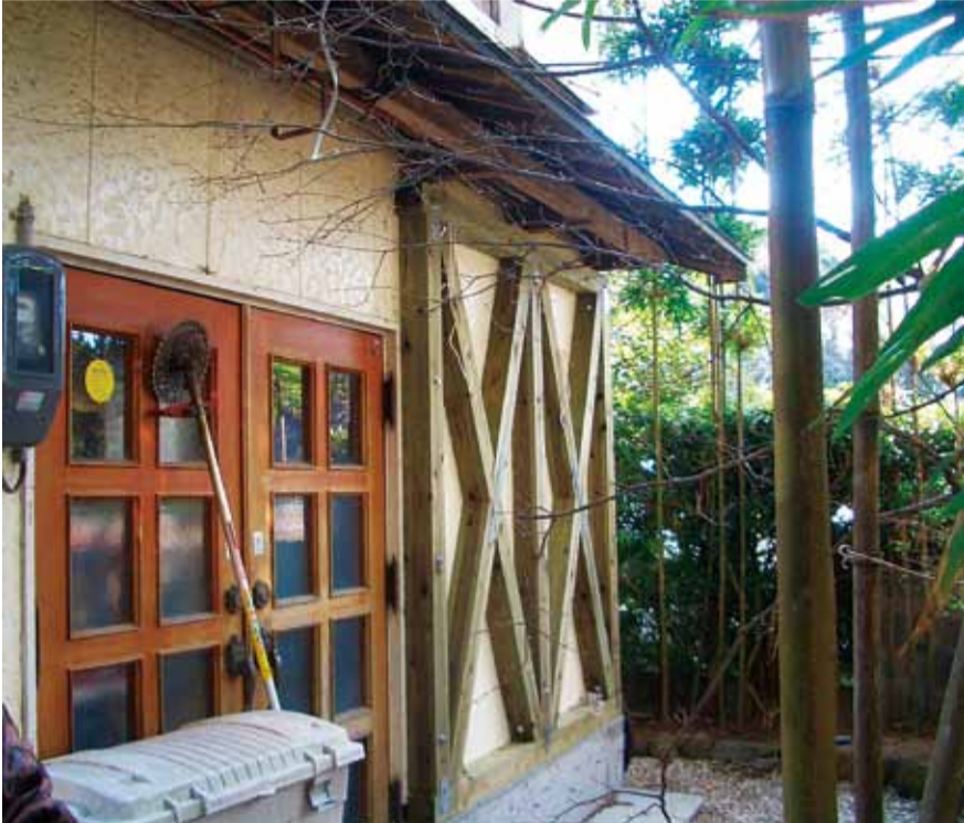
▲耐震改修を行った住宅(外フレーム補強)