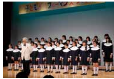
子どもを対象にしたいろいろな体験教室や子どもたちが出演する舞台などを楽しめる「子ども文化フェスティバル」を開催します!

[申し込み方法] はがきにコース名、住所、名前(ユースガーデニングコースの場合は年齢も)、電話番号、グループ参加の場合はその旨を記入の上、9月15日(祝)(必着)までに、とくしま植物園緑の相談所(〒771-4267 渋野町入道45-1 ☎636-3131)へ。※フリースタイル・ユースガーデニングコースはコンテナ、ハンギングなど作品ジャンルを記入してください。応募いただいた作品は後日、市ホームページに掲載します。