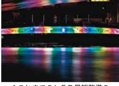
▲これまでのLED景観整備の例（ふれあい橋）

【対象】 ▶春日橋をキャンパスとしてLEDを使用した景観整備作品のデザイン画を描ける▶デザインを基にしたLED景観整備作品の完成まで関与できる▶LED景観整備作品は未発表のオリジナル作品である※応募には必ず募集要項（市役所4階まちづくり推進課などで配布。市ホームページからダウンロード可）をご覧ください。 【申し込み方法】 応募用紙や作品パース図などを10月31日（金）までに、まちづくり推進課（市役所4階 ☎621-5270 FAX621-5273）へ。