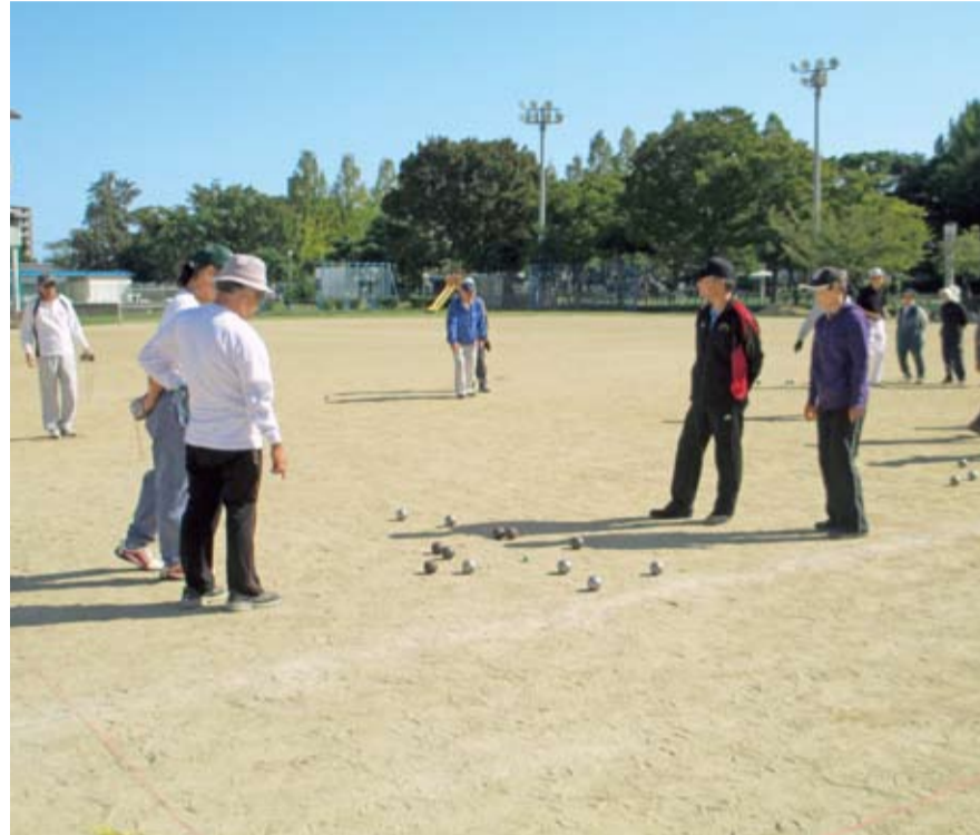
▲「ニュースポーツのつどい」でペタンクを楽しむ市民

らず、レクリエーションの一環として気軽に楽しむことを目的に、20世紀後半以降に考案されたスポーツです。人数や年齢、体力に合わせてルールを変えられるという特徴があり、日ごろ体を動かす機会の少ない人の健康・体力づくりや、世代を超えたコミュニケーションづくりの場として活用することができます。