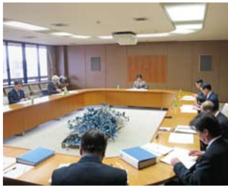
徳島東部地域における新たな 拠点都市づくりについて検討を 行うために徳島市・小松島市・ 佐那河内村で設置した「新拠点 都市創造検討会議」の第3回会 議を2月18日、徳島市役所で開 催しました(上写真)。