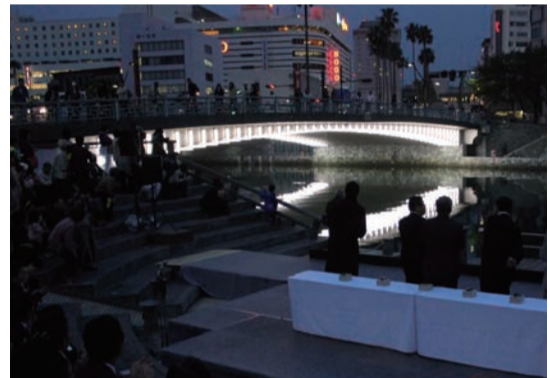
▲新町橋に整備された「光のマトリクス-白色LEDによるオペレッタ」の点灯式の様子=4月

フェスティバル期間外でも、新町川の「ふれあい橋」「両国橋」「新町橋」に整備されたLEDアート作品は毎日ご覧いただけます(点灯時間は日没から午後10時)。