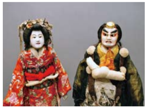
▲阿波木偶飾り人形