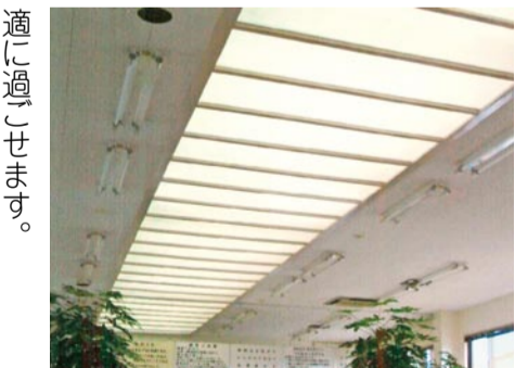
▲事務所内のあかりとり

市は昨年度、企業の実践に配慮した優れた取り組みを選定する「わが社のエコ自慢コンテスト」を実施し、9企業の取り組みを優れたものとして選定しました。その中で電気の省エネに関する取り組みを紹介しています。コンテストの詳細な内容は、市ホームページに掲載しています。