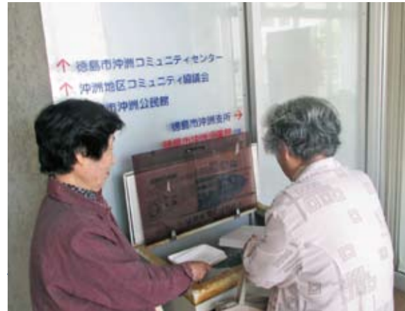
徳島市沖洲コミュニティセンター

「ごみの減量と限りある資源の再生を進めるため、皆さんの積極的なご協力をお願いします。」