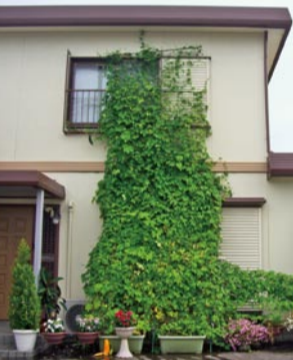
家電製品の省エネに加え、緑のカーテンを育てる

夏のピーク時には「エアコン」「冷蔵庫」「照明」「テレビ」の四つが全体の約8割を占めています。図のように、これらの四つの消費電力の大きい家電製品を上手に使えば、省エネ効果を上げることが出来ます。 上図は、夏の14時ごろの家庭における消費電力の割合(円グラフ)と、それぞれの省エネ対策を示しています。