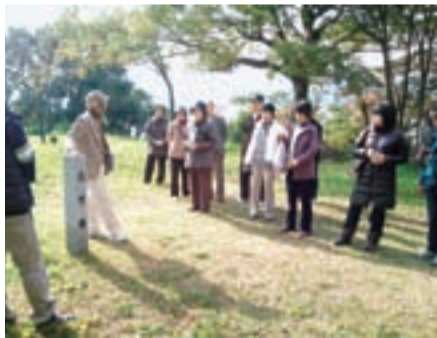
▲昨年11月のぐるりんツアーの様子

◆ボランティア友の会会員 徳島城博物館では、展示会などのガイド、イベントの実施や手伝い、ミュージアムショップの運営を行う「ボランティア友の会」の会員を募集します。活動は週1回の参加を原則とし、活動開始前に、3日間程度の研修を受けていただきます(4月6～8日の予定)。