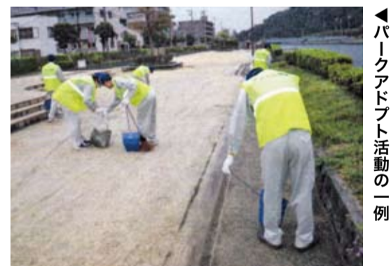
パークアドプト活動の一例

【活動内容など】参加団体は、活動内容と区域(公園の一部のみ)の活動も可)について、徳島市と協定を結び、パークアドプト活動を年3回以上行っているいただきます。また、参加者の活動を顕彰するため、担当する公園にパークアドプト表示板を設置することがあります。