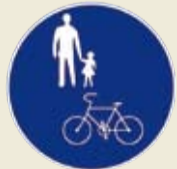
▲自転車通行可の標識