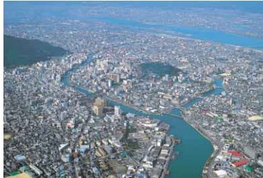
次の世代に健全な財政を引き継ぎます

市では、これまでも、厳しい財政環境に対応するため、職員定数の見直し(平成11年度から16年度までに174人削減。17年度も23人削減予定)や特殊勤務手当の見直しを行うことにより、人件費の抑制を図ってきたほか、行政評価システムの導入や公共工事コスト削減対策に関する行動計画の策定などによる事務事