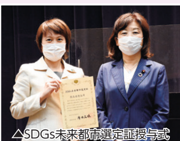
△SDGs未来都市選定証授与式