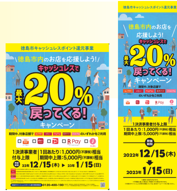
▲目印のポスターとのぼり

◆対象店舗 市内の中小規模店舗(右のポスターとのぼりが目印)などで対象キャッシュレス決済が使える店舗※コンビニエンスストア・大手飲食チェーン店・大手チェーン店(ドラッグストア、大型家電量販店など)・保険適用施設などは除く。 ※対象店舗リストは各決済アプリや当キャンペーン特設サイトで掲載しています。