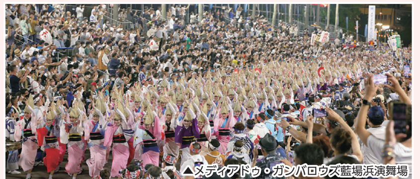
△ヌディアドゥ・ガンパロウズ藍場浜演舞場

2022阿波おどり(主催:阿波おどり未来へつなぐ実行委員会)が、3年ぶりに徳島市中心部の街中で開催され、街全体が「ぞめき」のリズムと踊りの熱気に包まれました。