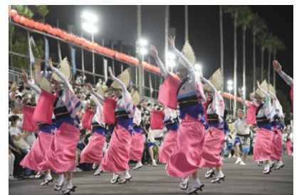
▲2022阿波おどりの様子

たのは、練習時間の確保が難しい中で素晴らしい踊りを披露いただいた踊り連の皆さま、踊り手に力を与えてくださった観客の皆さま、実行委員会やボランティアをはじめ運営に参画いただいた皆さま、また、困難な中で業務に従事されている医療関係者の皆さまなど、関係するすべての方々のご理解とご協力のおかげです。本当に感謝しかありません。今後は、コロナ禍においても、こうして繋いできた阿波おどりをしっかりと軌道に乗せて、サポートしていくのが本市の役割だと思っておりますので、「持続可能な阿波おどり」の構築を目指し、引き続き実行委員会とともに取り組んでまいります。