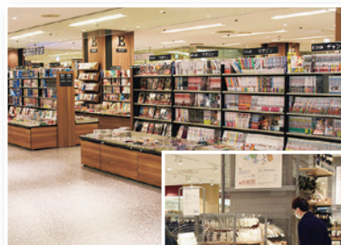
▲▶移転オープンした書店(上)と雑貨店(右)