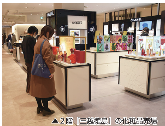
▲2階「三越徳島」の化粧品売場

【問い合わせ先】 徳島都市開発株式会社(☎621-4411 ☎621-4405)