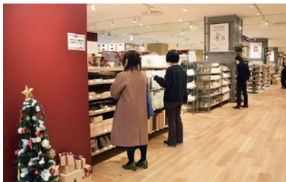
▲アミコビルの店舗

もちろん、まちづくりについては、私が市長に就任して以来、市民の皆さまはもとより、多様な団体と連携しながら邁進しているところですが、本計画が3月に内閣総理大臣に認定され、国からの重点的な支援を受けられるようになったことは、大きな一歩だったと思います。本計画のランドマーク施設の一つ「アミコビル」の再