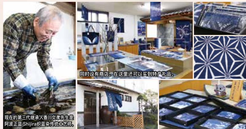
同时设有商店。在这里还可以买到特产礼品。

将受世界青睐的日本蓝 (Japan Blue) 传承至今 蓝染工艺馆 (阿波友禅工厂)