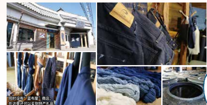
同时设有“蓝布屋”商店。在这里还可以买到特产礼品。

给保持清凉的布料·阿波 Shijira (棉織) 织注入生命 风本织布工厂·织工厂 蓝布屋