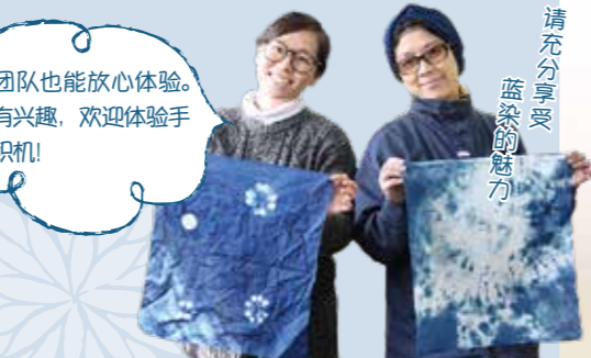
请充分享受蓝染的魅力

体验套餐 需至少提前5天预约 最多可接待 100 人 (需提前咨询) 仅接受现金支付