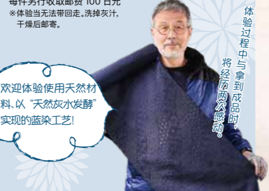
体验过程中与拿到成品时, 将经历两次感动。