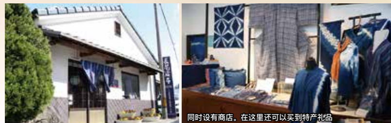
同时设有商店。在这里还可以买到特产礼品。