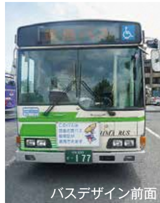
バスデザイン前面