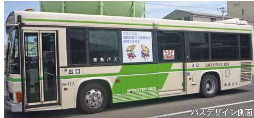
バスデザイン側面

A 徳島バスの車両で運行しますが、他の徳島バスの車両と区別するため、写真(イメージ)のような専用車両で運行します。