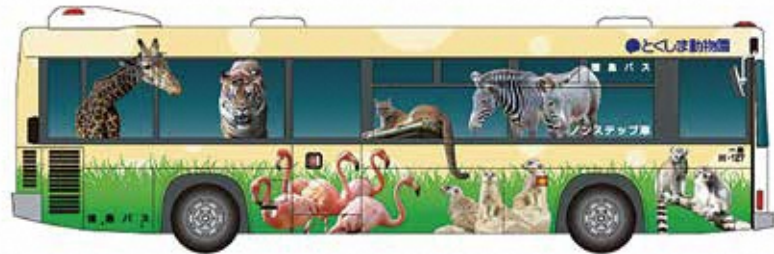
動物園バスデザイン側面

渋野線(一部の便)では、車体に動物をデザインしたバスが運行するよ。車内も楽しめるから乗ってみてね。