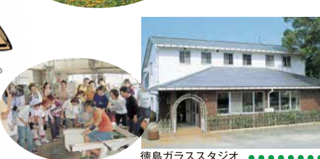
徳島ガラススタジオ