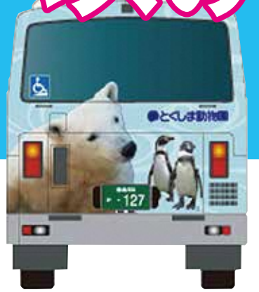
渋野線(一部の便)を運行する動物園バスデザイン後面

これまで、徳島市交通局が運行していましたが、平成26年10月1日から徳島市が 徳島バス株式会社 へ運行業務を委託します。