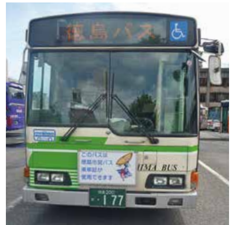
バスデザイン前面