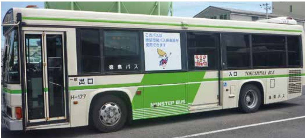
バスデザイン側面

A 徳島バスの車両で運行しますが、これまでの委託路線と同様に次のような車両で運行します。