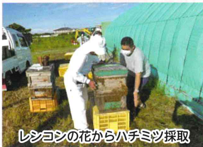
レシヨンの花からハチミツ採取