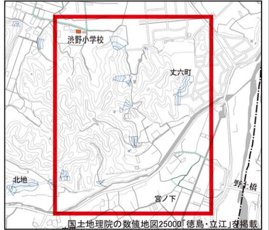
位置図 (1/25,000) 国土地理院の数値地図25000「徳島・立江」を掲載

（※）平成26年から30年の台風時に徳島市が確認した道路冠水箇所と地元消防団が大雨時に確認した道路冠水箇所を記載しています。降雨の状況によっては、他の場所も冠水するおそれがありますので注意してください。